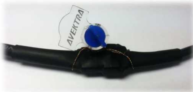
Рисунок 3. Пломба на электрической магистрали проточной части.

Корпус тепловычислителя имеет крепление для установки на проточную часть. При этом проточная часть может располагаться вертикально или горизонтально. Для установки тепловычислителя отдельно от проточной части на его корпусе расположено углубление. После подключения электрической магистрали от проточной части к тепловычислителю разъем на проводе герметизируется термоусадочным кембриком и пломбуется специальной пломбой, идущей в комплекте с теплосчётчиком (рис.3).