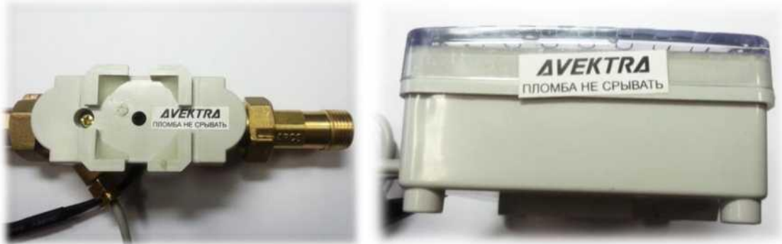
Рисунок 5. Заводская пломба на корпусе расходомера и корпусе вычислителя.

После установки и подключения проточной части, тепловых датчиков и корпуса вычислителя теплосчётчик готов к работе.