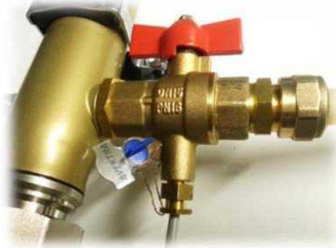
Рисунок 2. Пломба на шаровом кране.

Корпус тепловычислителя имеет крепление для установки на проточную часть. При этом проточная часть может располагаться вертикально или горизонтально. Для установки тепловычислителя отдельно от проточной части на его корпусе расположено углубление. После подключения электрической магистрали от проточной части к тепловычислителю разъем на проводе герметизируется термоусадочным кембриком и пломбуется специальной пломбой, идущей в комплекте с теплосчётчиком (рис.3).