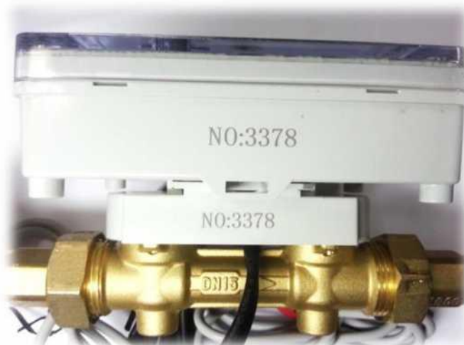
Рисунок 4. Серийный номер и отверстие в накидной гайке присоединителя.

ВНИМАНИЕ!!! При установке серийный номер на тепловычислителе должен совпадать с серийным номером на расходомере (рис.4).