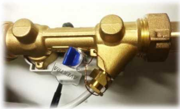
Рисунок 1. Пломба на проточной части.